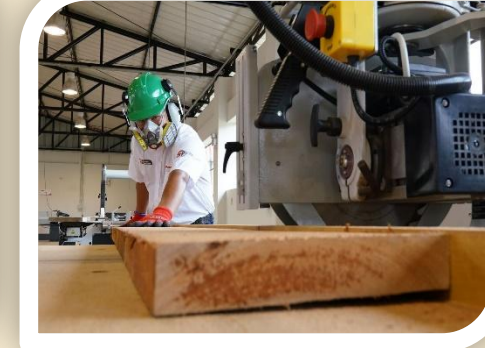
Madera y más

Fomentar la colaboración y vinculación entre la academia y la empresa