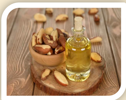
Aceite de Castaña

Articulación y fortalecimiento de redes de actores