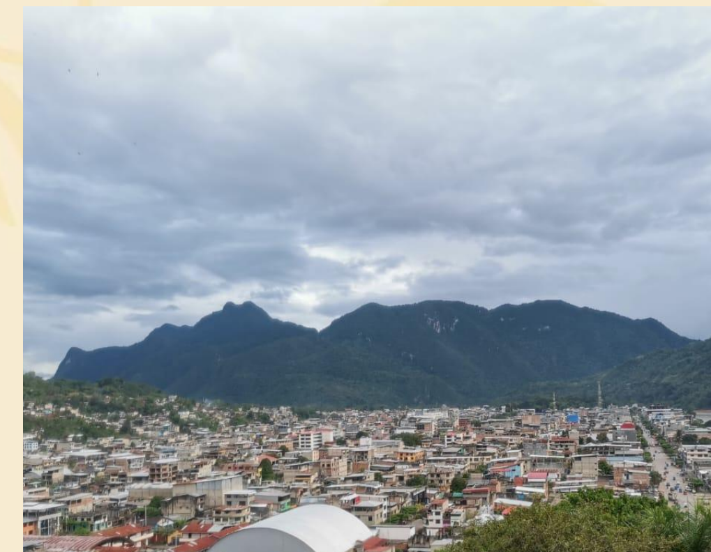
LA BELLA DURMIENTE- LEONCIO PRADO