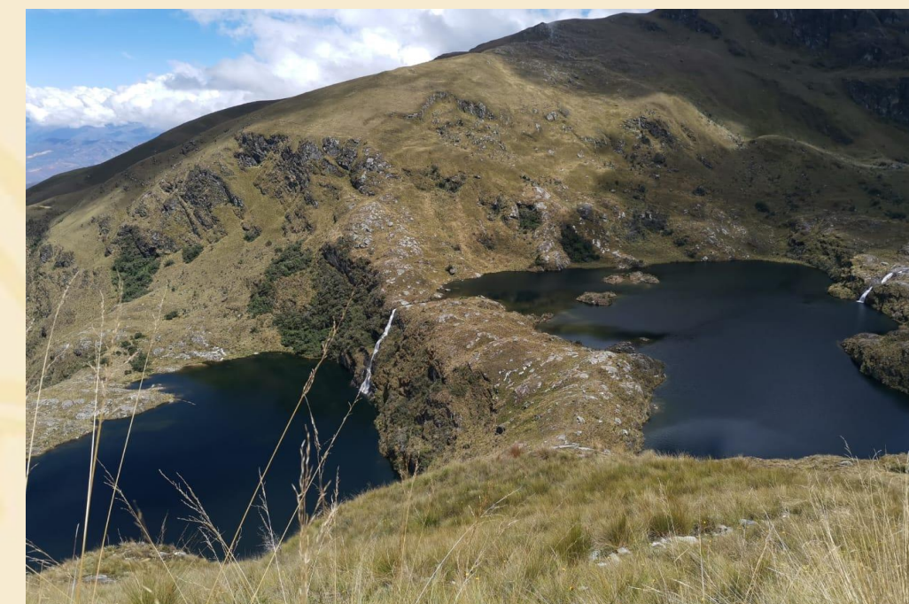
CINCO LAGUNA (PICHGACOCHA) - AMBO