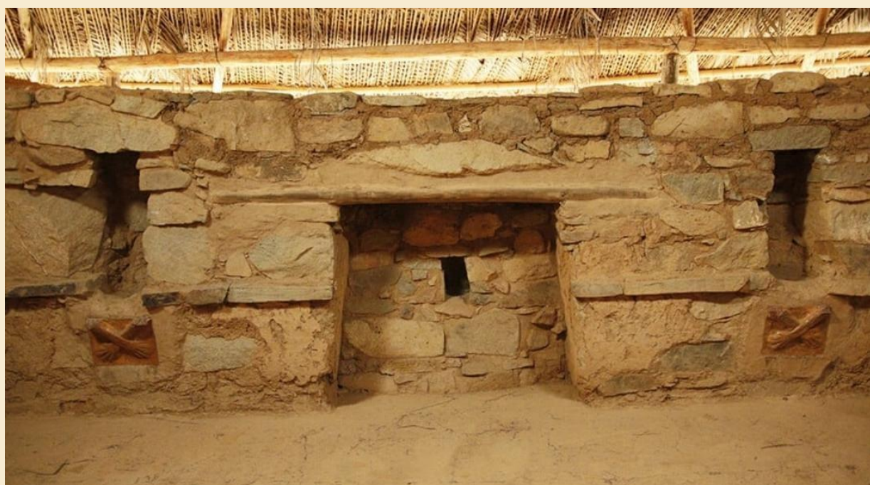
KOSTOSH – TEMPLO DE LAS MANOS CRUZADAS - HUÁNUCO