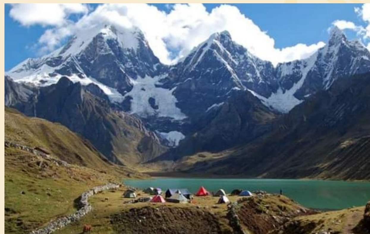
CORDILLERA HUAYHUASH - LAURICOCHA