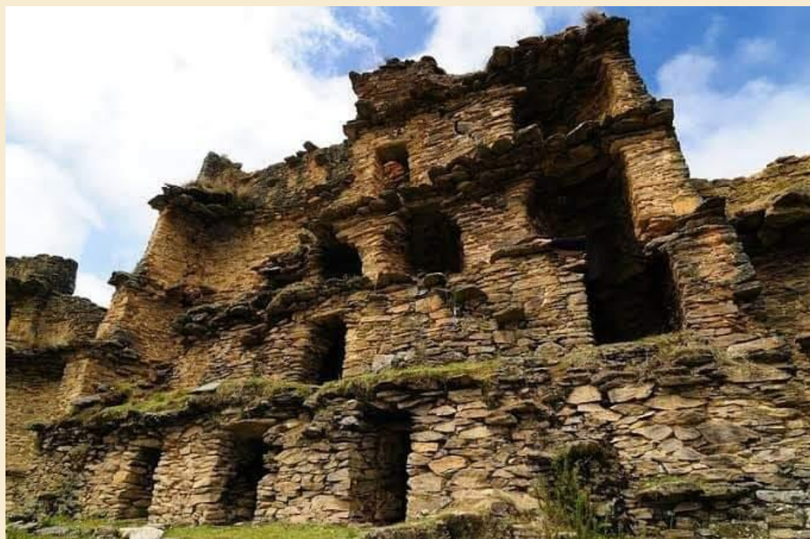
RASCACIELOS DE TANTAMAYO- HUAMALÍES