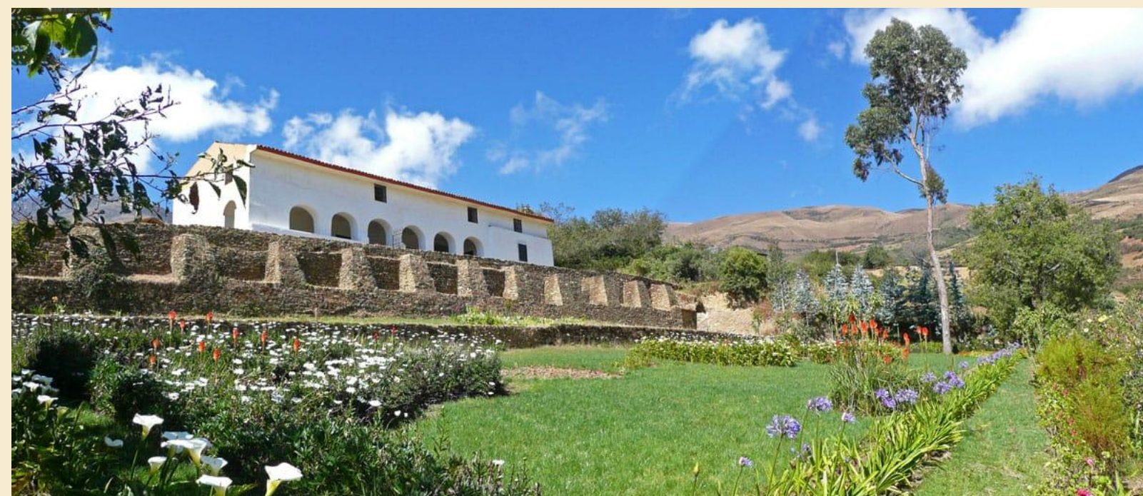
HACIENDA DE SHISHMAY – AMARILIS - HUÁNUCO