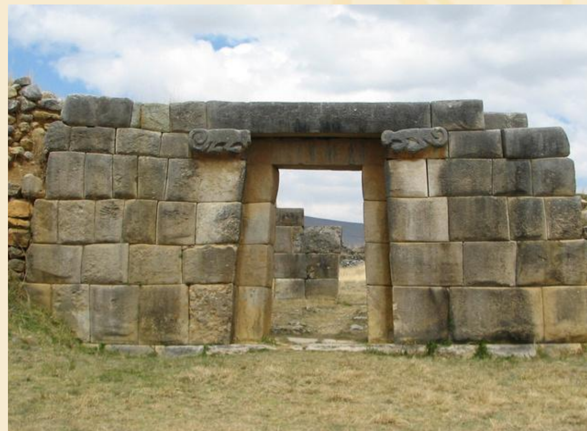
HUÁNUCO VIEJO – DOS DE MAYO