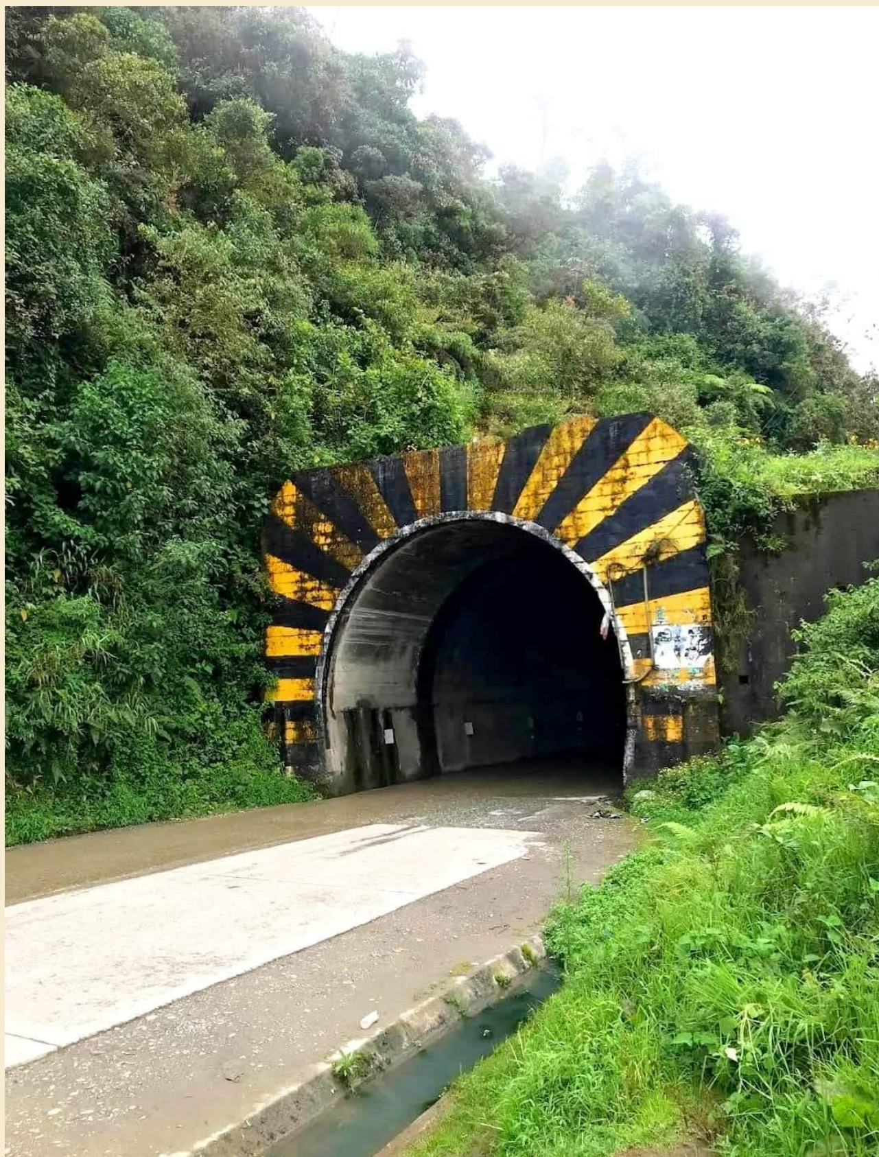
TÚNEL DE CARPISH - HUÁNUCO