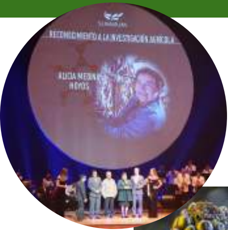
Caracterización de papas nativas Tayabamba y Chugay