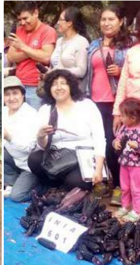
Promoción y evaluación en campo de papa y maíz biofortificado