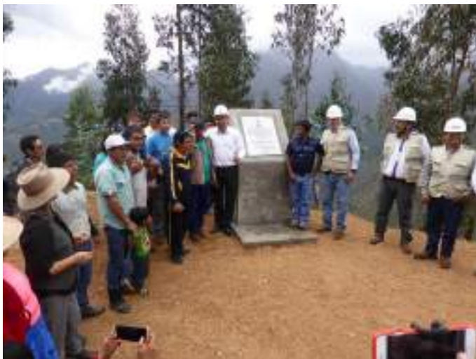
Sistema de riego Chuquitambo